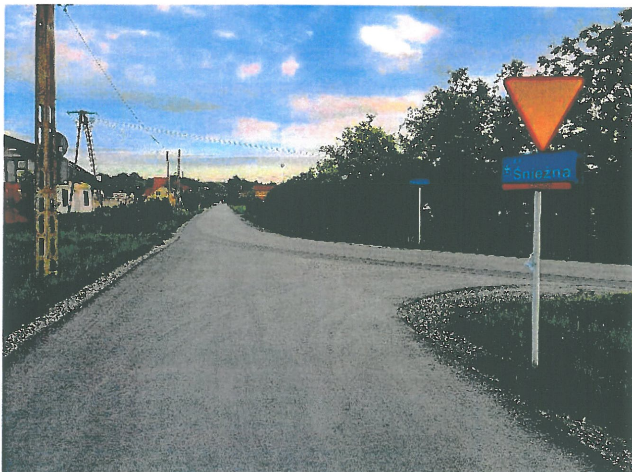
Skrzyżowanie ul. Porąbki z ul. Śnieżną